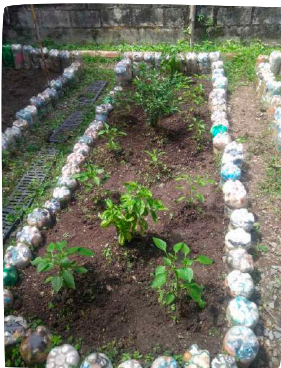
Huertas de Piamonete