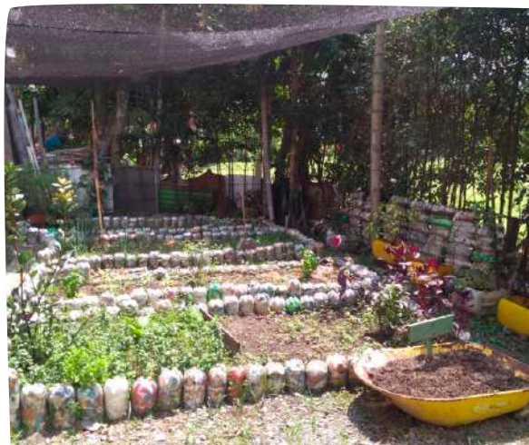
Huertas de Piamonte, sembradas en la comuna 15, Guayabal

La importancia de estos procesos no solo radica en que la comunidad siembra y cosecha su propio alimento, sino también en la contribución que esto tiene para lograr la sostenibilidad social y la construcción de ciudadanía, en tanto hay participación comunitaria activa.