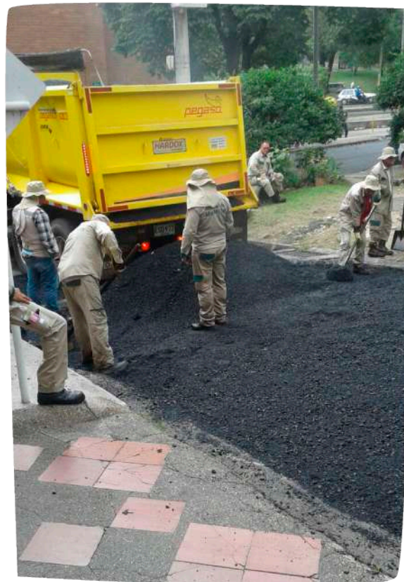
Repavimentación, sector Las Margaritas